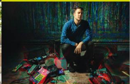
Beat matazz : Petit prince des pads

http://www.elisekusmeruck.fr choralelume@gmail.com